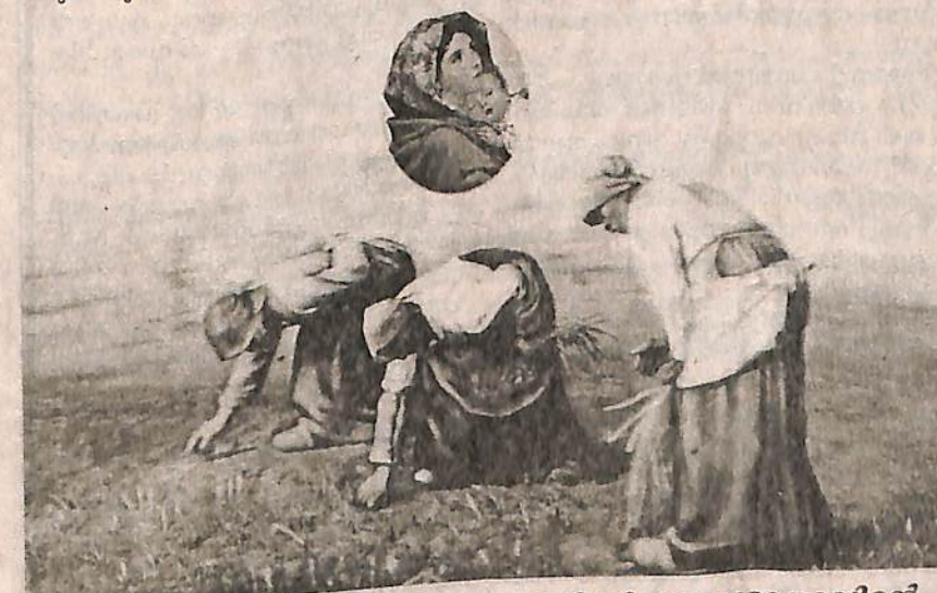
ജനുവരി 15. വിത്തുകൾക്കുവേണ്ടി വി. ദൈവമാതാവിന്റെ പെരുനാൾ

മാനസ്സാന്തരപ്പെട്ട് സുവിശേഷത്തിൽ വിശ്വസിക്കുക എന്നതാണ് പ്രസംഗവിഷയം സഭാവിശ്വാസവും വി. പാരമ്പര്യങ്ങളും, ആരാധനയും, കുടുംബങ്ങളും മെല്ലാം നമ്മെ മാനസ്സാന്തരത്തിലേക്കു